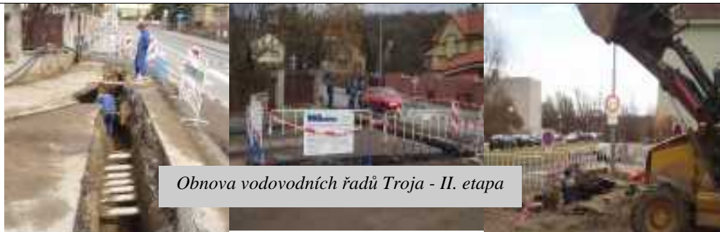
Obnova vodovodních řadů Troja - II. etapa