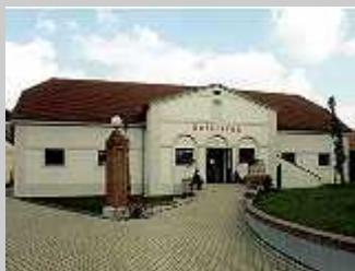
Kočárovna v areálu zámku ve Ctěnicích otevřeno so + ne a 17.4. 10 - 18 s unikátní expozicí historických kočárů

Zámek Ctěnice (Praha 9 - Vinoř) - otevřeno so + ne a 17.4. 10 - 18 s expozicí „Za císaře pána...“, Habsburkové v českých zemích 1791 - 1914