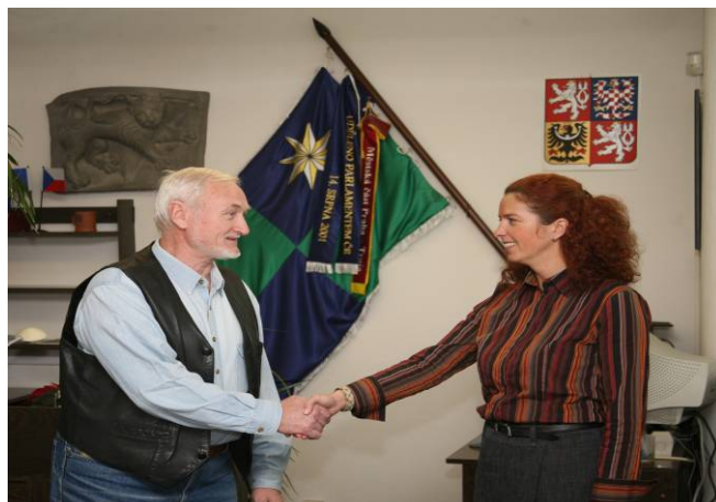
Předávání „žezla“ na Úřadu městské části Praha-Troja