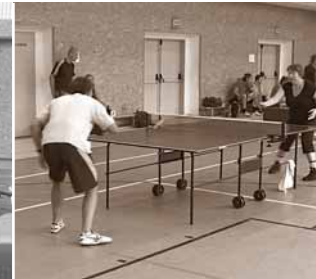
7 Tenis stolní