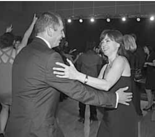
4 Tancem do r. 2014