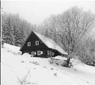
5 Hurá, jarní prázdniny