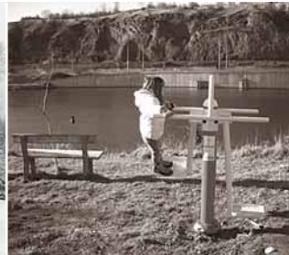
5 Zhoupněte se