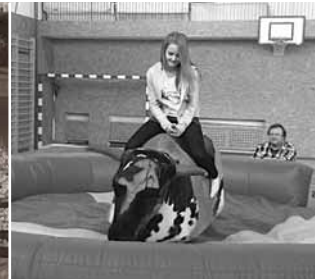
6 Rodeo školní