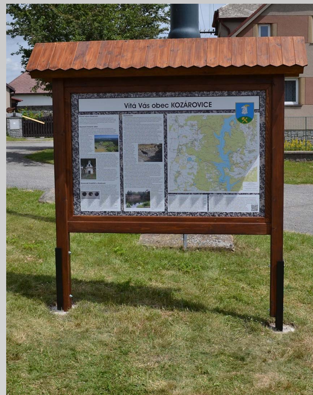
Ukázka Informačního panelu s rozměry vnitřní desky 100 x 150 cm.