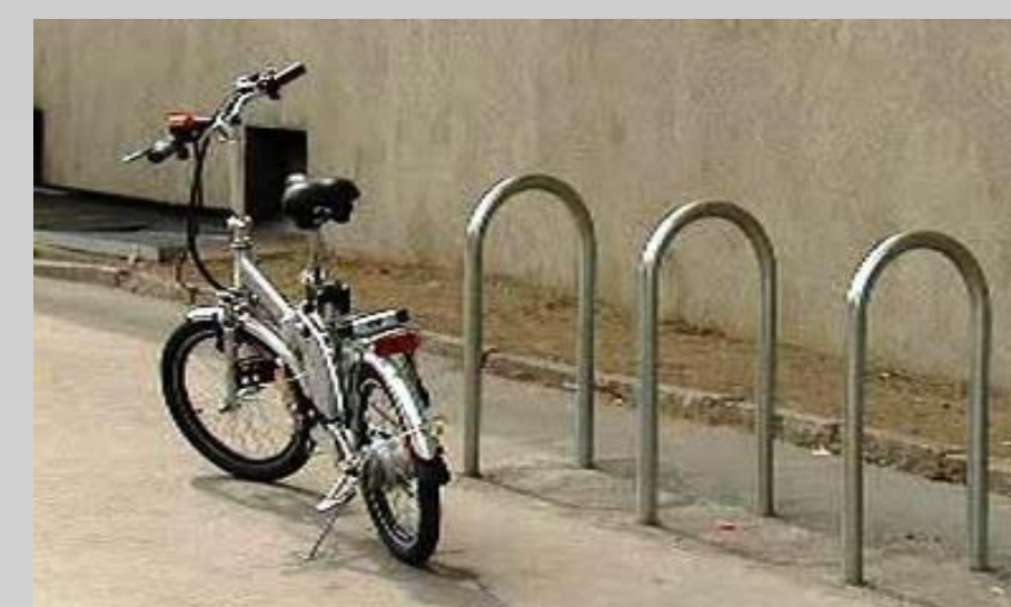
Ukázka nového městského mobiliáře: lavička a stojany na kola.