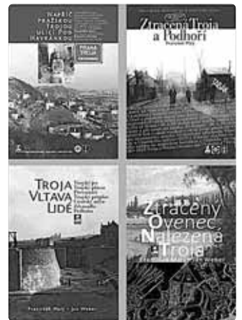
Publikace z historie Troje