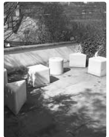
Posezení u kaple sv. Václava