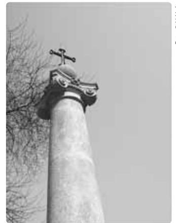
Presun viničního sloupu 2002