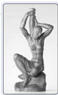
Žena s amforou 1938